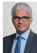
Ashok Sridharan Oberbürgermeister der Stadt Bonn